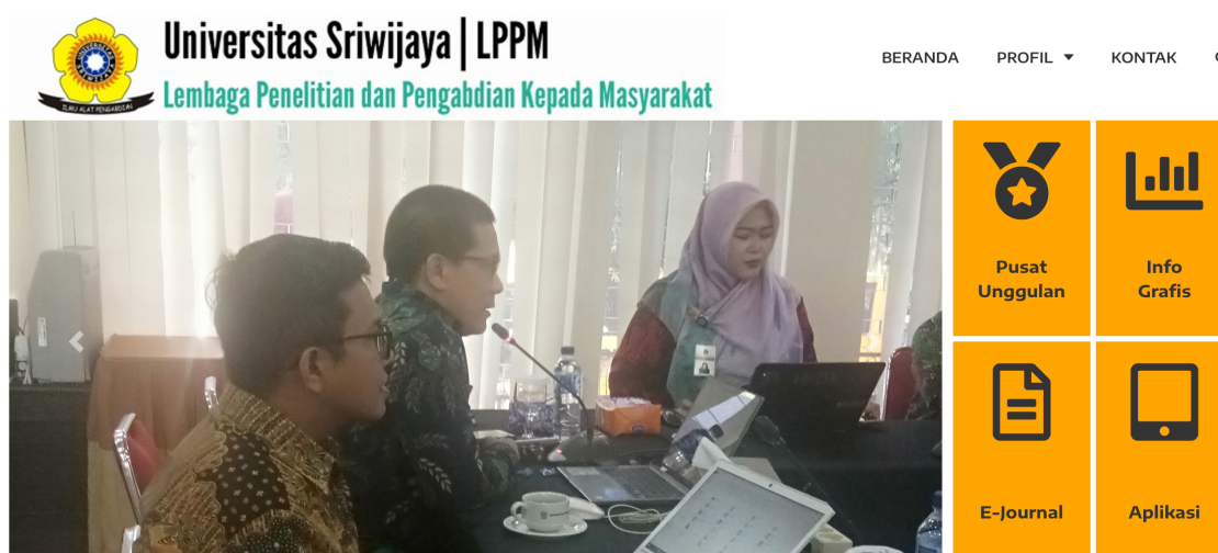
Gambar 1. Web site LPPM Universitas Sriwijaya

Seiring dengan semakin kompleks dan luasnya cakupan pelaksanaan penelitian dan pengabdian kepada masyarakat di Universitas Sriwijaya, mulai tahun 2019 Lembaga Penelitian dan Pengabdian Kepada Masyarakat (LLPM) mengembangkan sistem pengelolaan penelitian dan pengabdian masyarakat berbasis teknologi informasi dan komunikasi (TIK). Sistem tersebut dinamakan Sistem Informasi Penelitian dan Pengabdian kepada Masyarakat yang selanjutnya disebut SIM LPPM dengan url sim.lppm.unsri.ac.id . Dengan SIMLPPM, proses pengajuan dan seleksi usulan, monitoring dan evaluasi pelaksanaan, laporan akhir, penggunaan anggaran, serta pelaporan hasil-hasil penelitian dan pengabdian kepada masyarakat dapat dikelola dengan baik sehingga transparansi, efisiensi dan akuntabilitas dapat dijamin. Untuk mengusulkan proposal melalui website LPPM yaitu pada url www.lppm.unsri.ac.id dan akan tampak seperti Gambar 1 berikut ini,